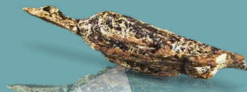
Wasservogel vom Hohle Fels