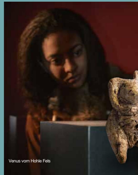
Venus vom Hohle Fels